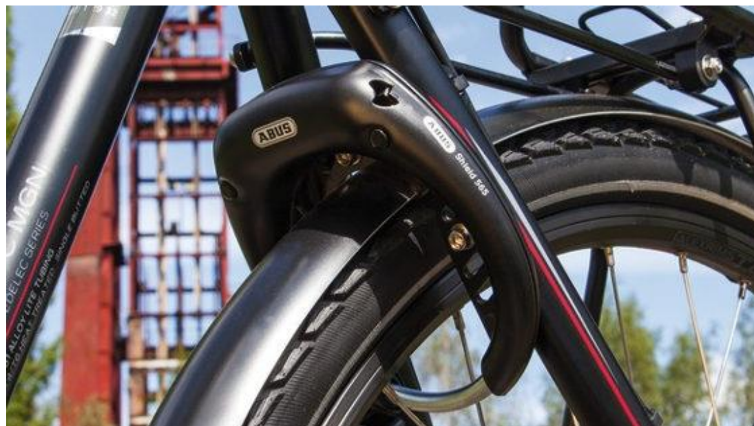
Exemple d'antivol de cadre