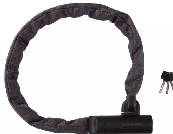
Exemple de chaîne

https://www.decathlon.fr/p/antivol-velo-chaîne-900-1/_/R-p-145609