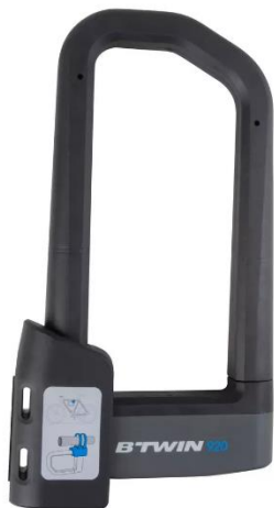
Exemple de cadenas en U

https://www.decathlon.fr/p/antivol-u-velo-920/_/R-p-145313?mc=8331481&gclid=EA1aIQobChMin_aasp5_U6QIVxTYVCh3s7ALHEAQByABEgIcmPD_BwE