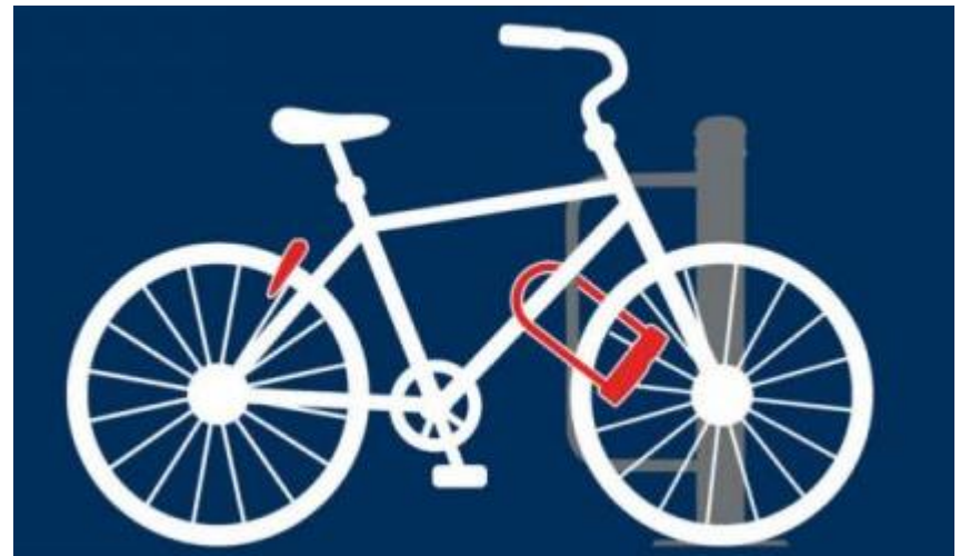
Attache U et antivol de cadre

https://www.commeunvelo.com/wp-content/uploads/2018/03/bien-attacher-velo-antivol-ville.png