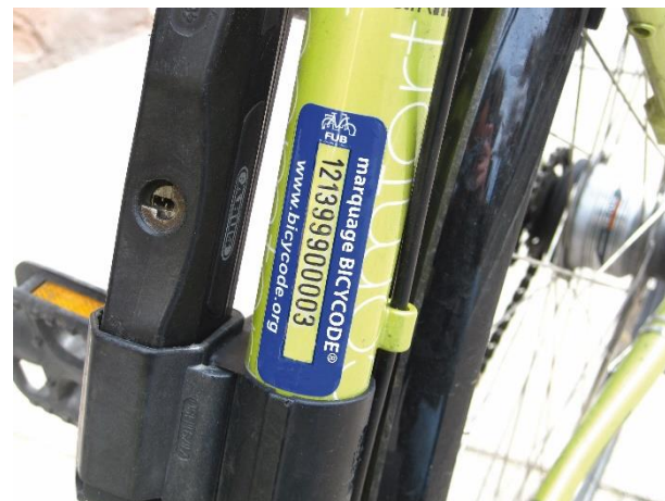
Exemple de marquage BICYCODE®