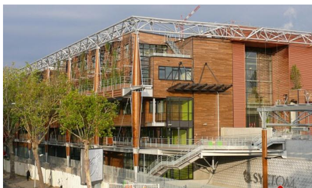
Centre de traitement des déchets Isséane à Issy-les-Moulineaux

Ces déchets sont mis en centre d'enfouissement technique (CET) de classe 2 où les déchets sont isolés du milieu naturel afin de mieux gérer les polluants qui en résultent.