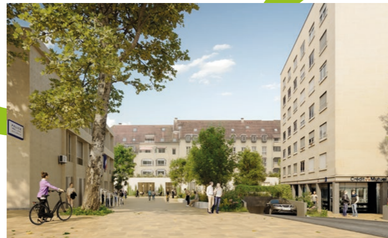
4 La future place centrale vue depuis le commissariat, avenue de l'Europe