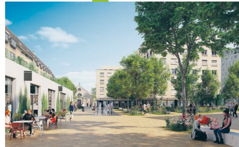
1 La future place centrale depuis l'emplacement actuel du marché