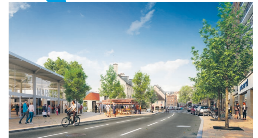
3 La future entrée de ville et le nouveau marché vus depuis le 62, Grande Rue