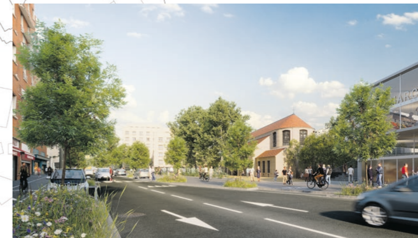
2 La future entrée du cœur de ville depuis le 5, avenue de l'Europe