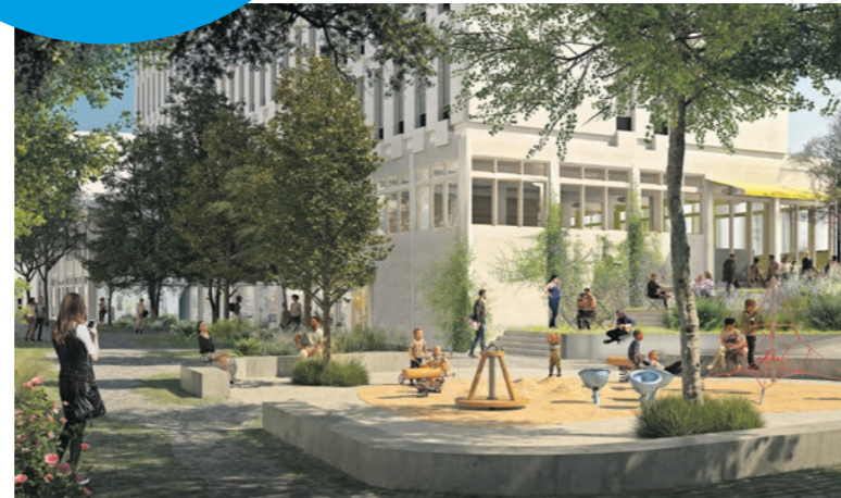
5 Le futur square du Docteur Charles-Odic et son nouvel accès à l'avenue de l'Europe